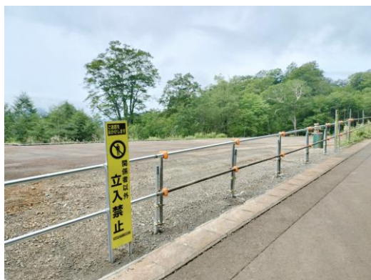
（地熱発電所跡地・立ち入り禁止）