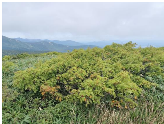
（三ッ石山山頂付近のミネカエデ）